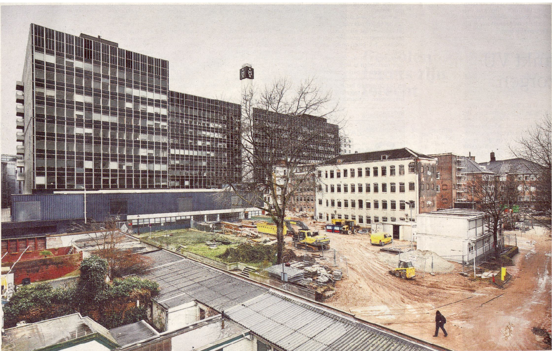
De burens van de nieuwe campus hebben het zware materieel zowat in de achtertuin. Als de rupsbanden van een bulldozer in de grond wringen, voel je dat hier al.